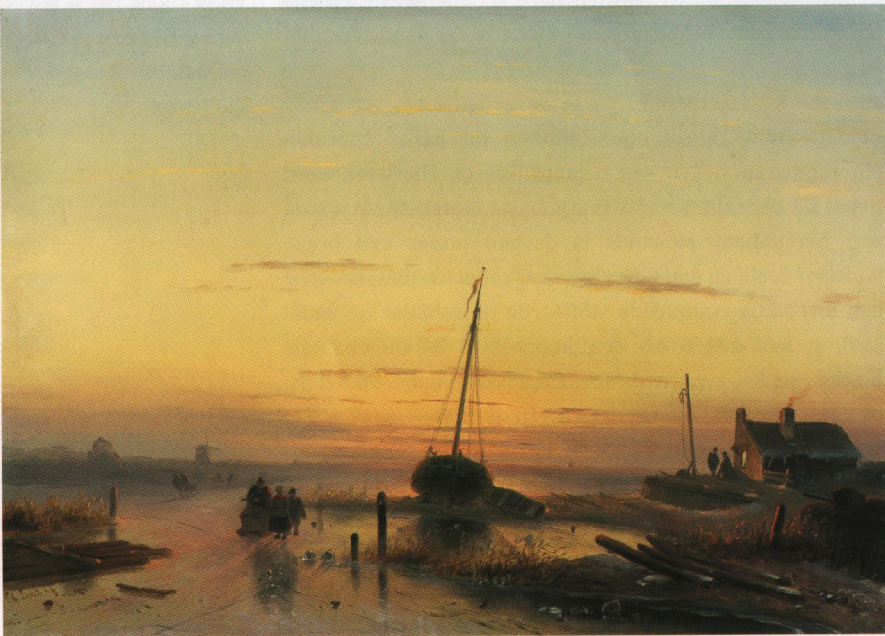
5. C.H.J. Leickert, Winterlandschap bij ondergaande zon , olie/paneel, 32,6 x 46,1 cm, gesign.

Andries Schelfhout (1787-1870) was zonder twijfel de beroemdste vertolker van het romantische ijsgezicht. Hij was al in de twintig toen hij de lijstenmakerij van zijn vader verliet en in Den Haag in de leer ging bij de toneeldecora-