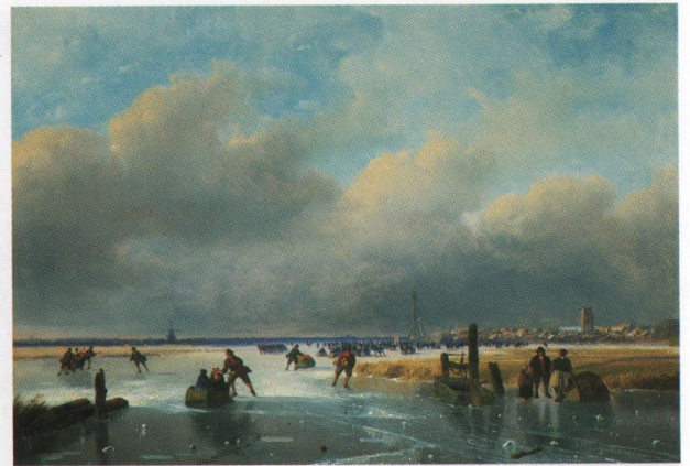
4. N.J. Roosenboom, Ijsvertier bij Dordrecht , olie/paneel, 35,1 x 49,6 cm, gesign.