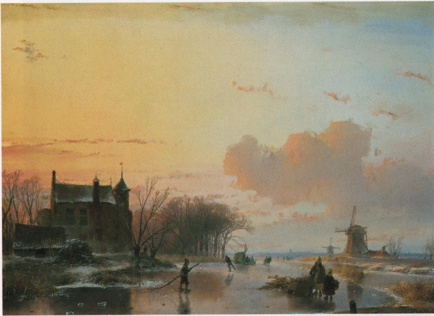
3. A. Schelfhout, Ijsgezicht met houtspokkelaars , olie/paneel, 38,5 x 49,8 cm, gesign., 1845.

variatie toepasten. De grote Schelfhout pakte dit anders aan: hij maakte schetsen naar de natuur, waardoor hij zijn werk steeds kon voorzien van nieuwe, 'verse' motieven.