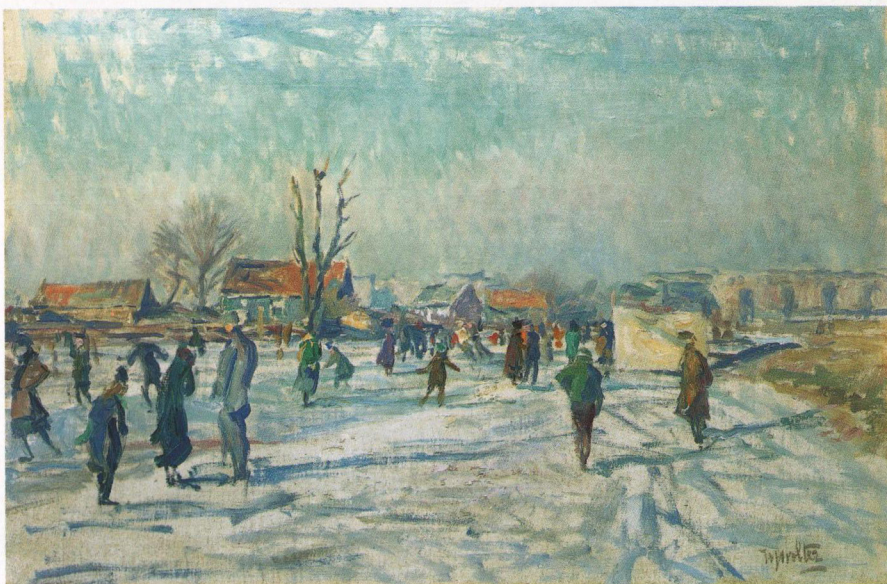
6. H.J. Wolter, Schaatsers op de Boerenwetering, Amsterdam , olie op doek, 40,5 x 60 cm, gesign.

(afb. 3). Het verhalende element is hier tot een minimum teruggebracht: hier en daar een klein figuurtje, en een moeder en kind met een slee met brandhout. Daarmee legt hij de nadruk op de grootsheid van de (winterse) natuur waaraan de mens ondergeschikt is, een geliefd thema in de romantiek.