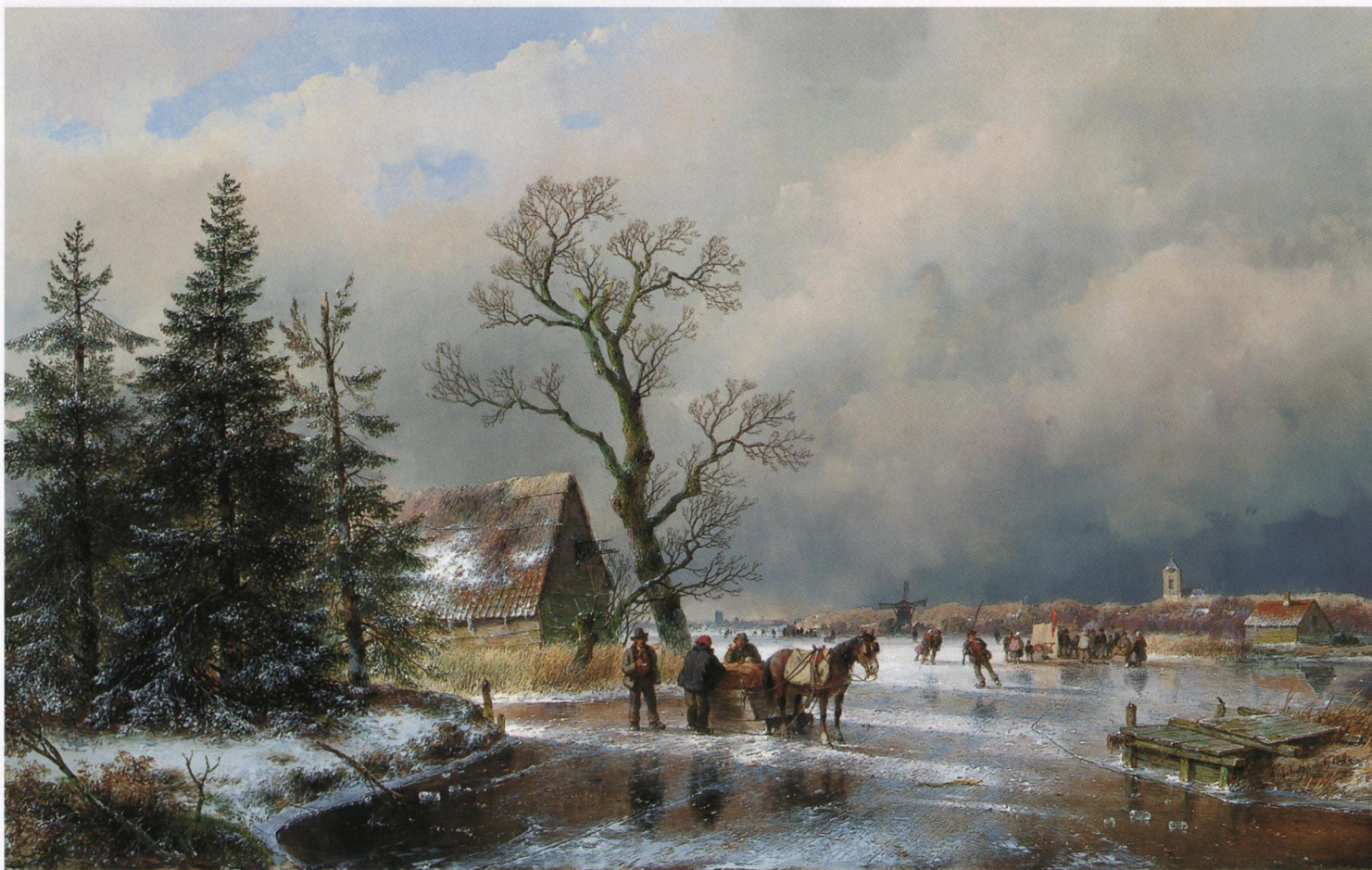
2. A. Schelfhout, Schaatsvolk en trekslede op bevroren vaart , olie/paneel, 52,2 x 83 cm, gesign., 1869